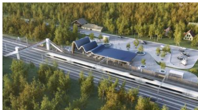
Reģionālie mobilitātes punkti