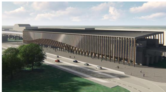
Rail Baltica stacija un infrastruktūra lidostā «Rīga»