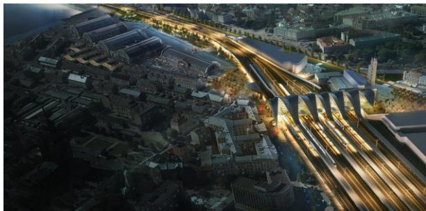
Rail Baltica Centrālais mezgls