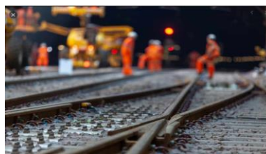
Infrastrukturā apkopes punkti Iecavā un Skultē