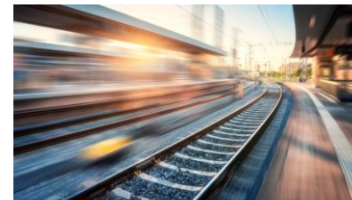
Infrastrukturā pārvaldības sistēmas izveide