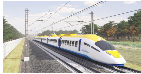
Rail Baltica pamattrases būvniecība