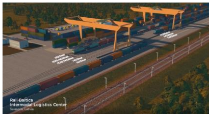
Salaspils intermodālais loģistikas termināls