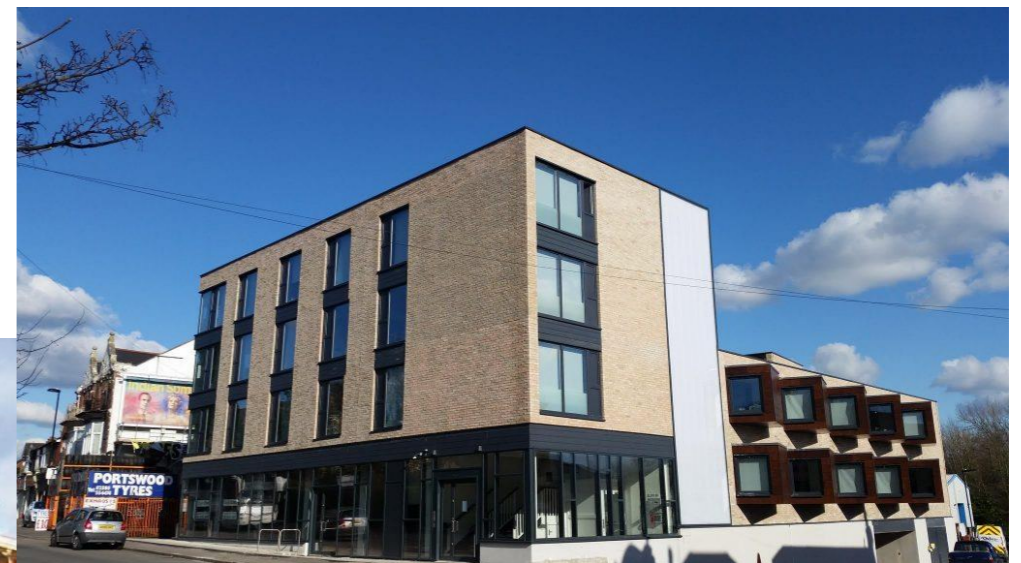
Koka karkasa moduļu ēkas