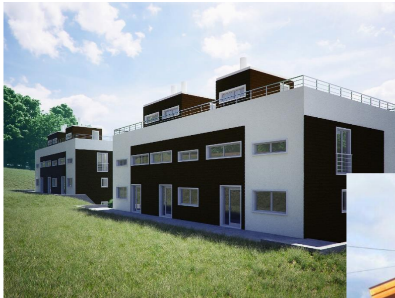
Koka karkasa paneļu ēkas